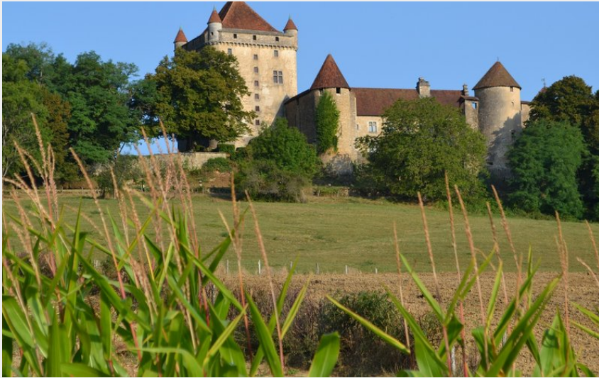
Chateau du Pin