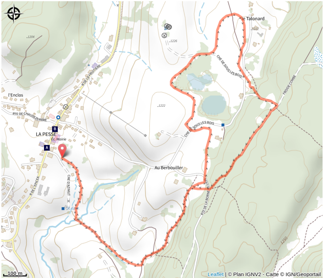
La Pesse - Le village (A)