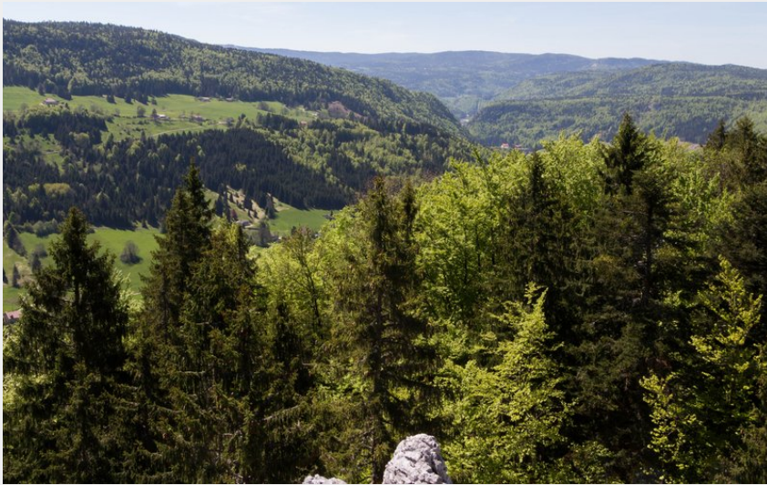
(PNRHJ / Nina Verjus)