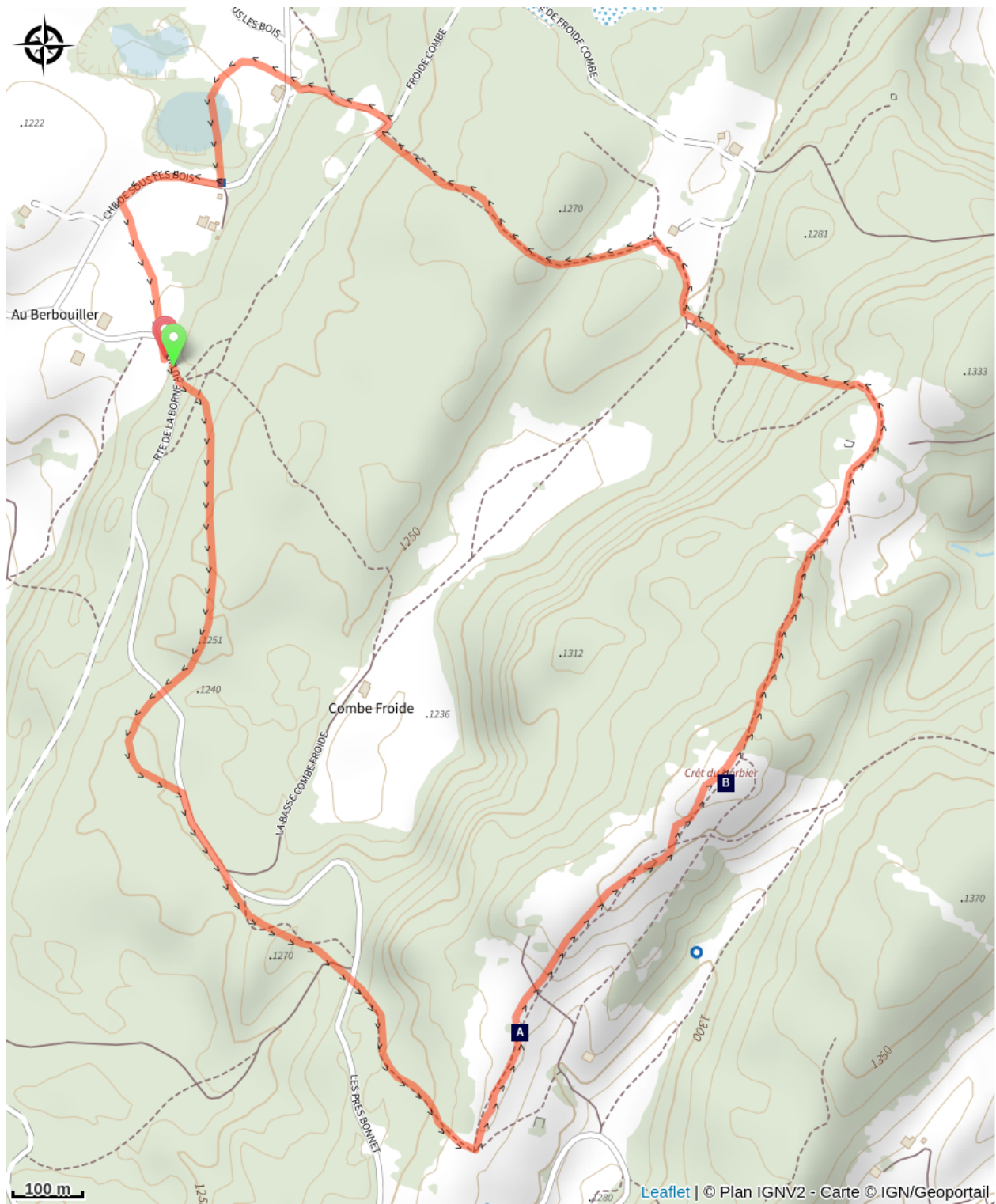
Le Col du Nerbier (A)