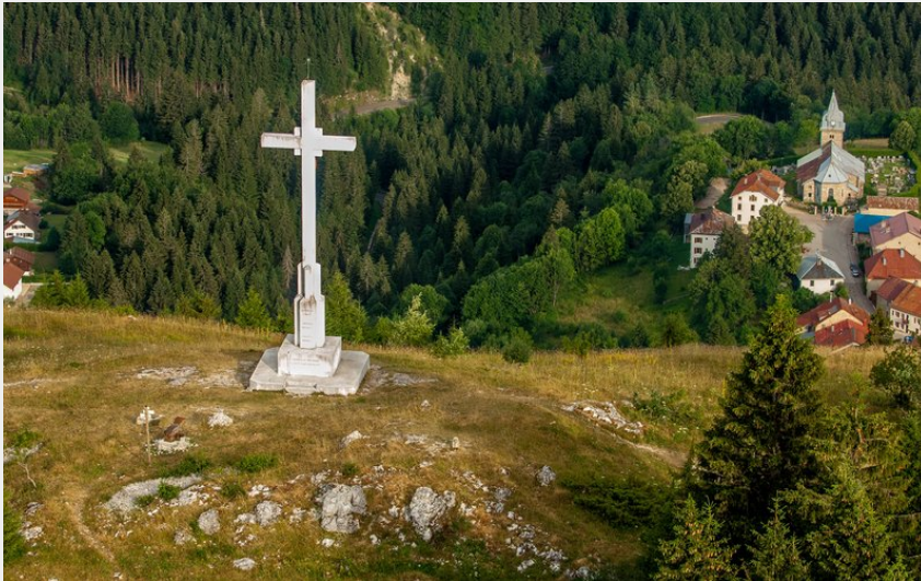
(© Marc SUMERA)