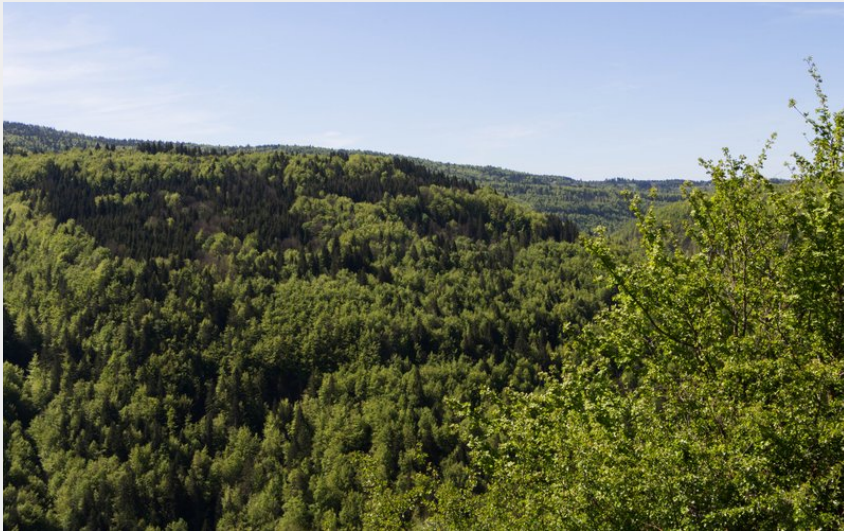
Point de vue (PNRHJ) / Nina Verjus