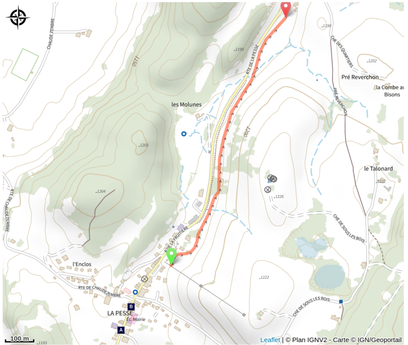
La Pesse - Le village (A)