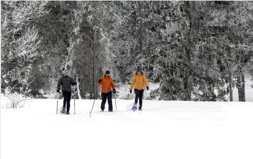
(© Laurent CHEVIET)