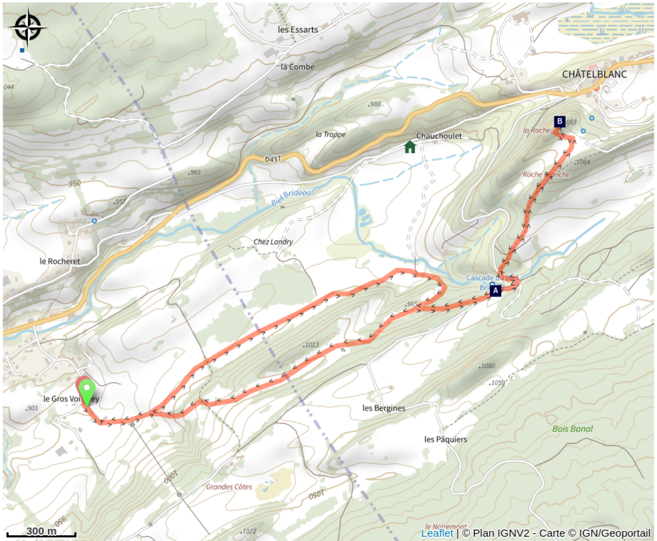
Cascade du Bief Brideau (A)