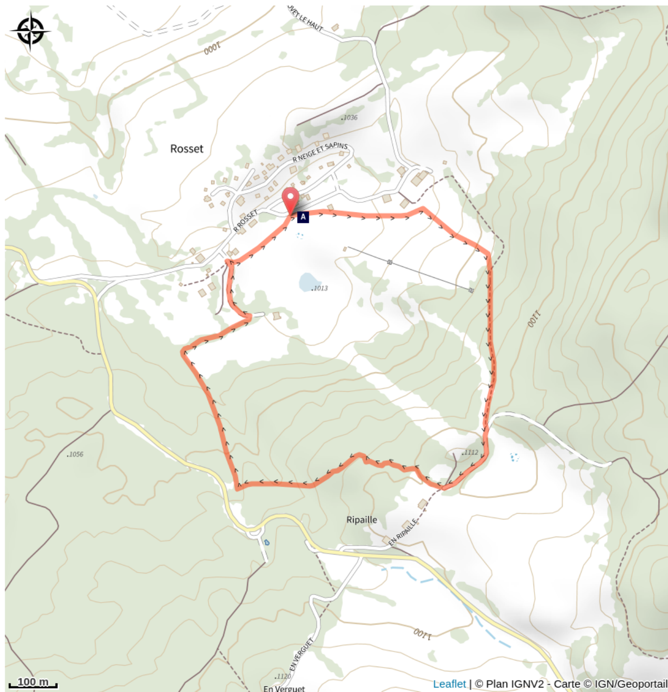
Le grenier fort (A)