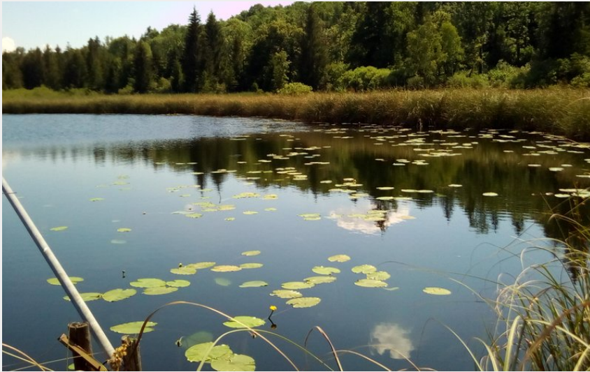
Lac Onoz (Mairie Onoz)