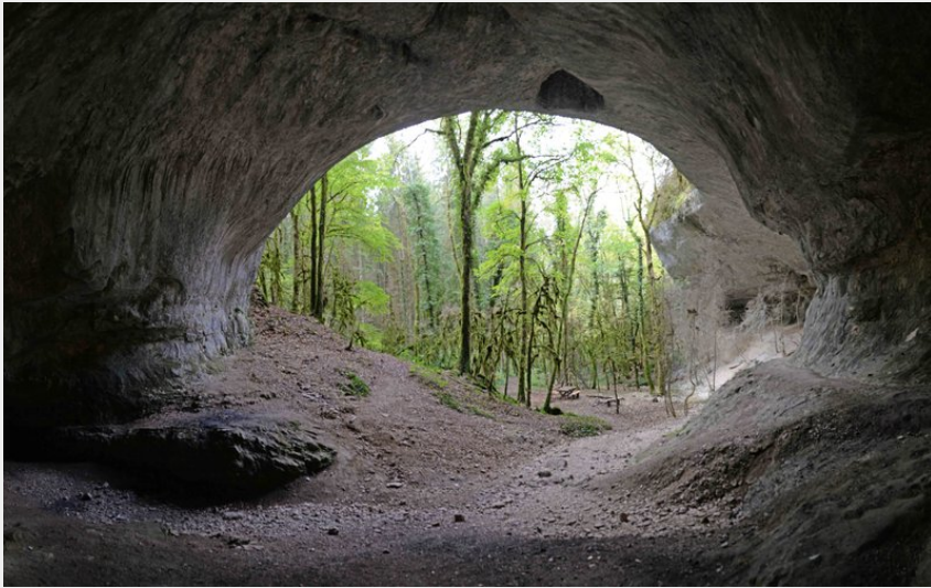
La Caborne du Boeuf