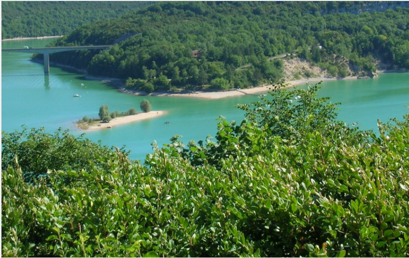
Lac de Vouglans (Clara BURTIN)