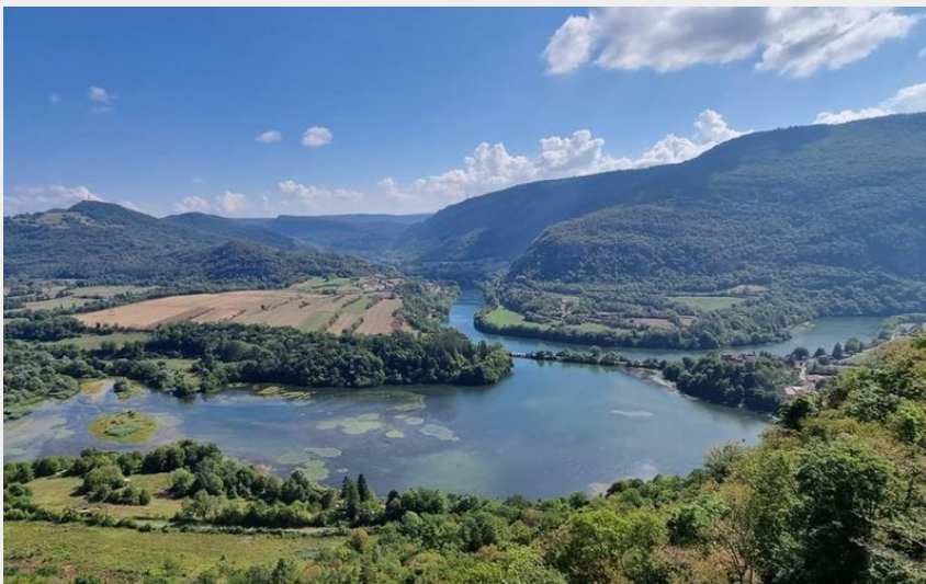
Vue depuis la chapelle de St Maurice d'Echazeaux