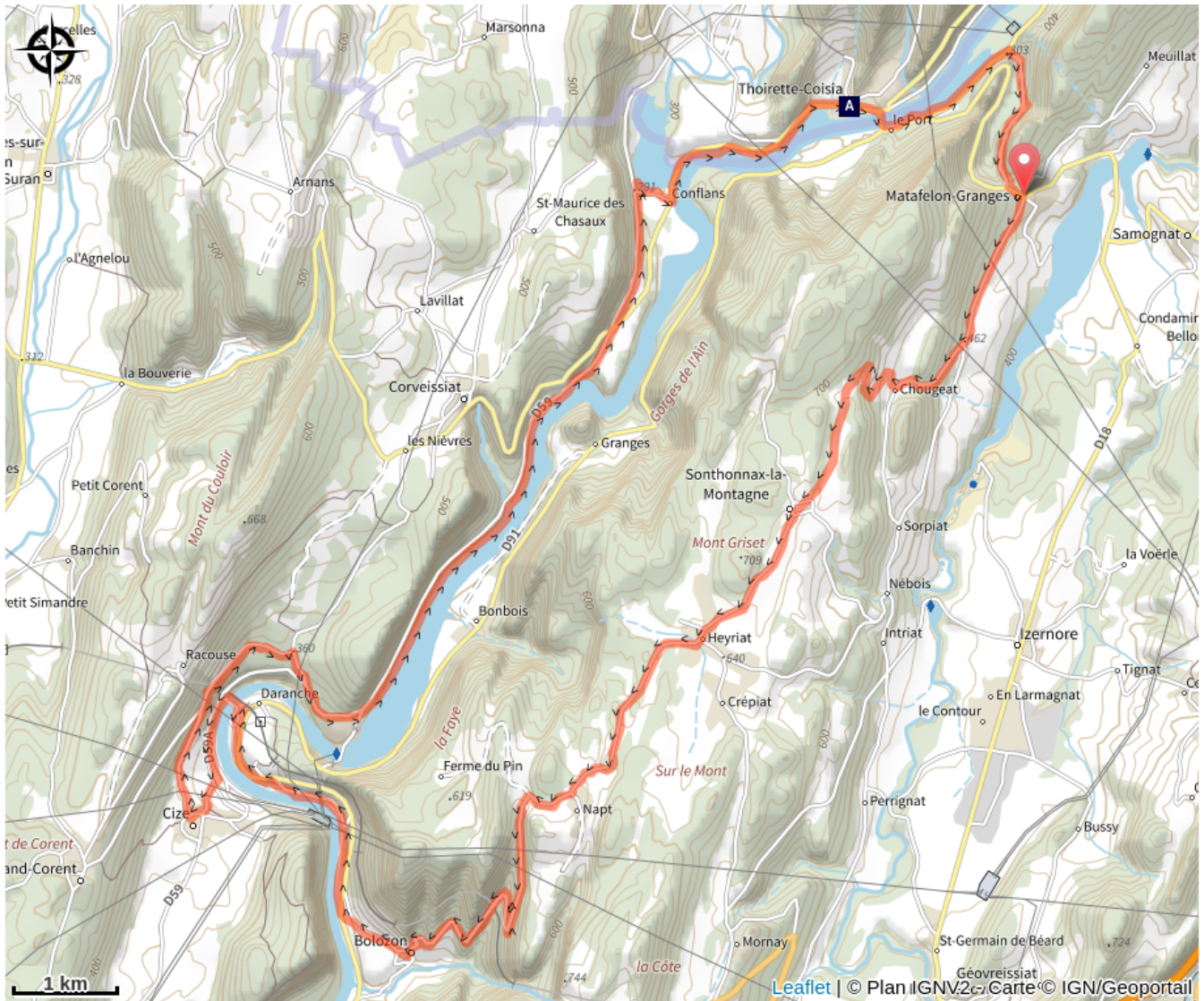
La Lône (A)