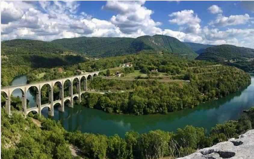
viaduc de Cize