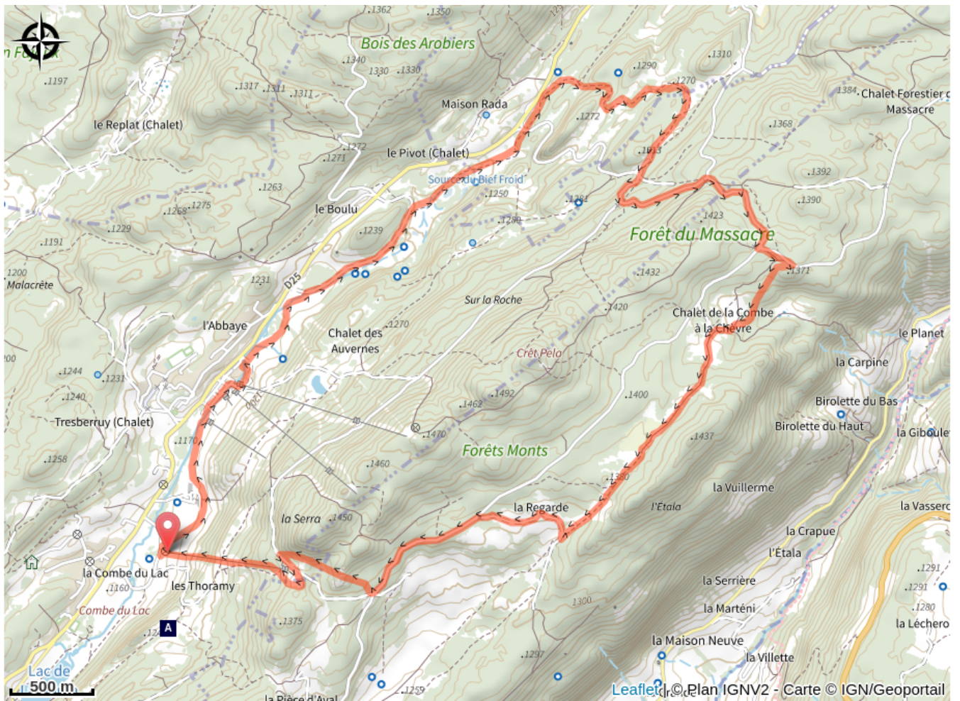
Chalet d'estive/alpage (A)