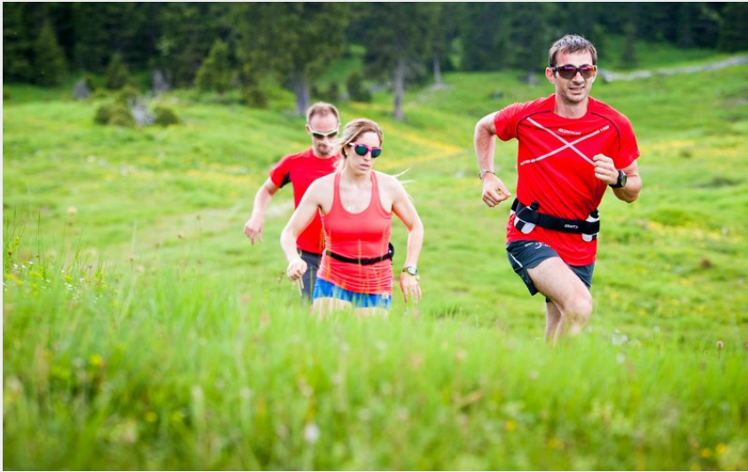
Trail sur le secteur Haut-Jura Saint-Claude