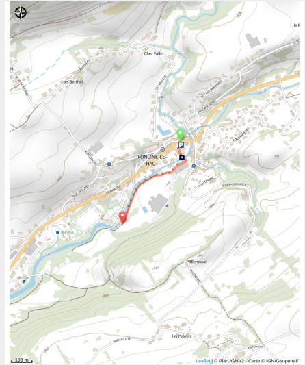
Trail à Foncine-le-Haut

A Foncine-le-Haut, petit village typique du Parc naturel régional du Haut-Jura, ce petit parcours vous permet de réaliser un petit échauffement ou de faire vos séances spécifiques à plat le long de la Saine sur une distance définie.