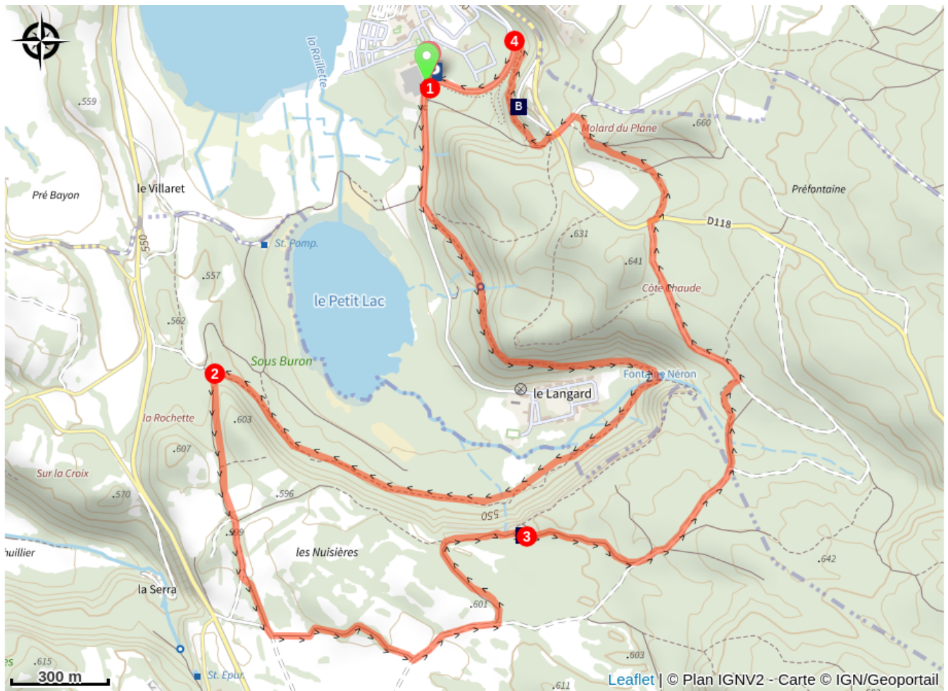
Belvédère de la Scie (A)