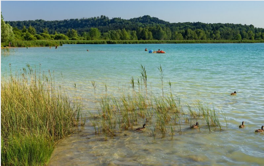
Lac de Clairvaux