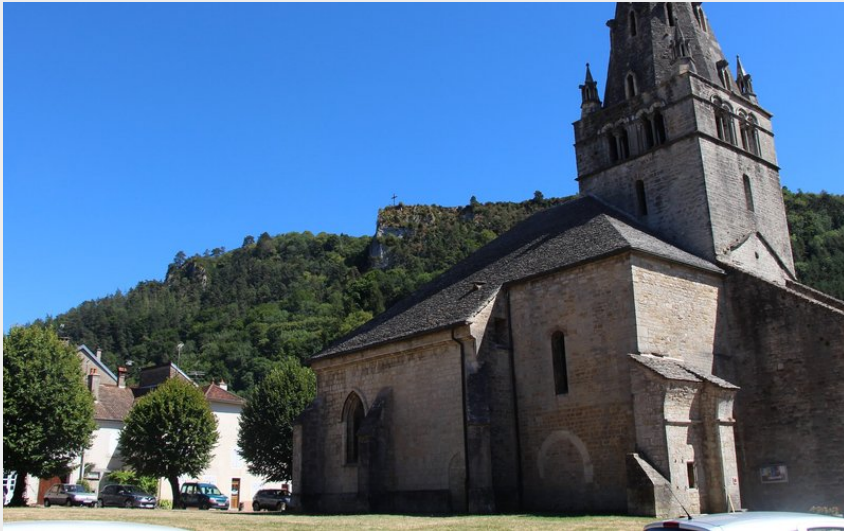
Église Notre-Dame de Mouthier-le-Vieillard à Poligny