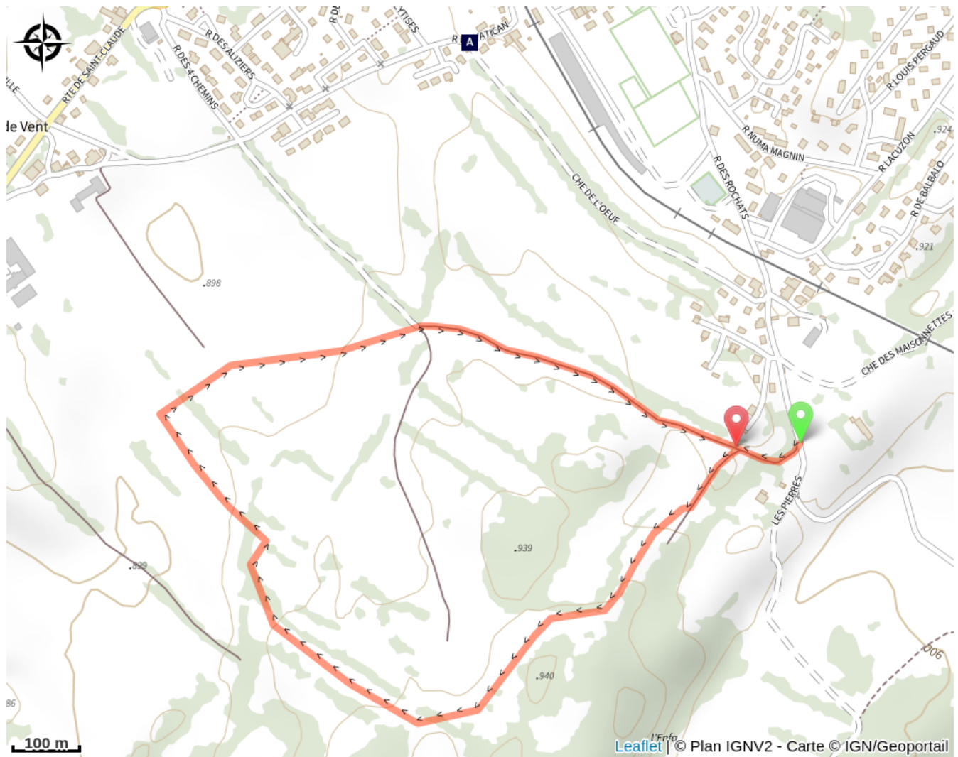
La chapelle de Salave (A)