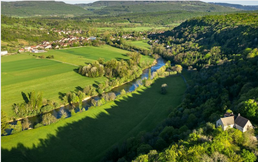
Vallée de la Loue à Port-Lesney