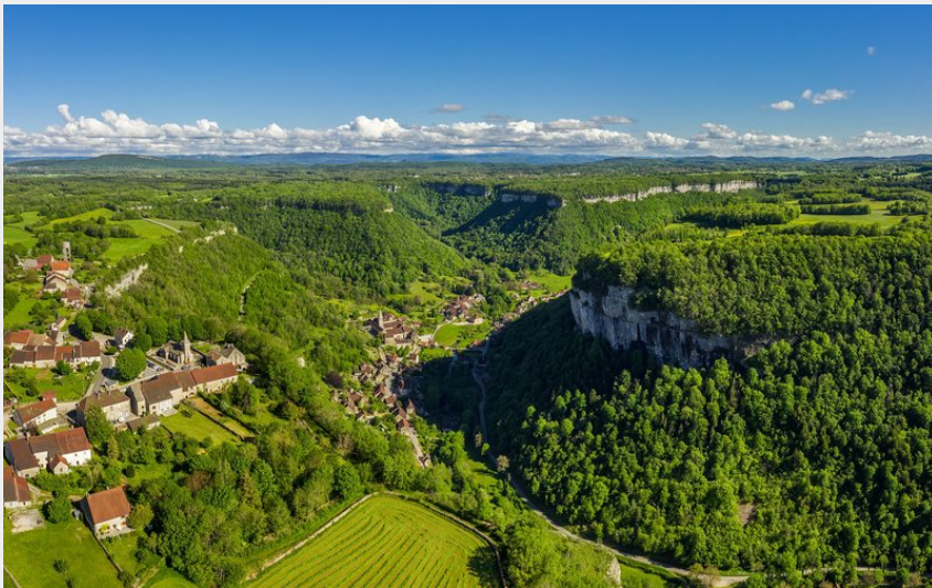
Reculée de Baume-les-Messieurs