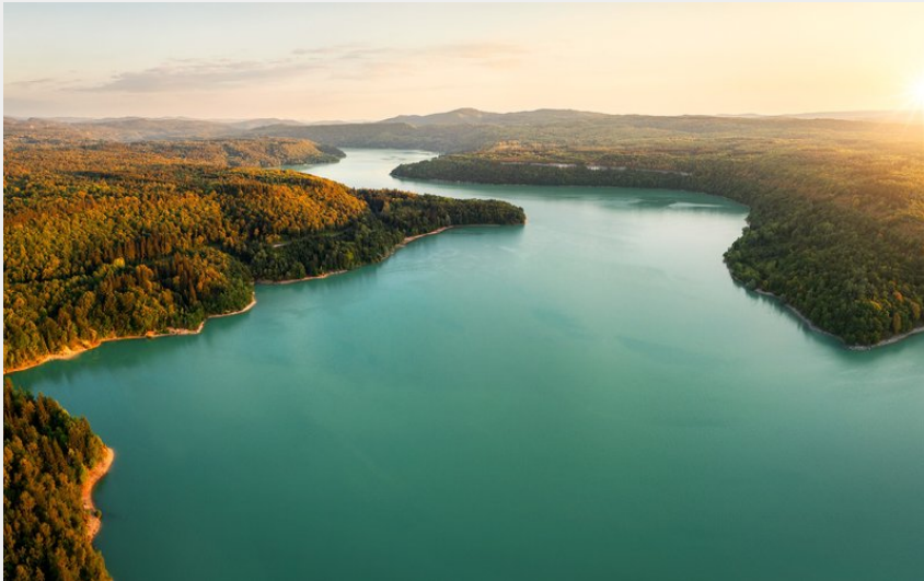
Lac de Vouglans