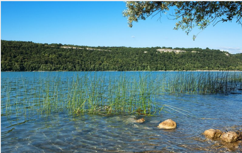
Lac de Chalain