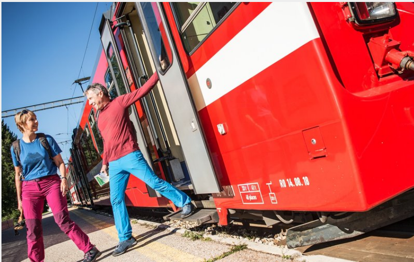
Petit train Nyon > La Cure