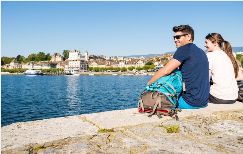
Randonneurs à Nyon devant le lac Léman