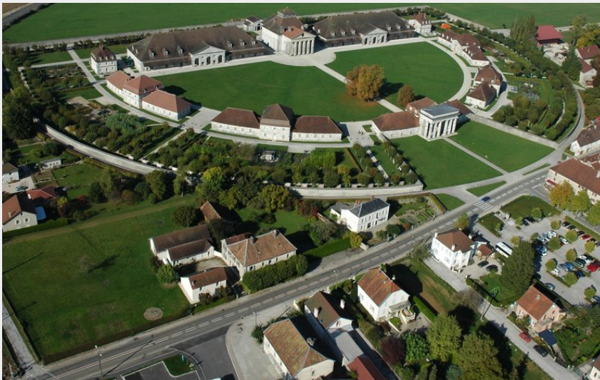
Saline Royale d'Arc-et-Senans