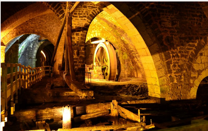
Grande Saline de Salins-les-Bains