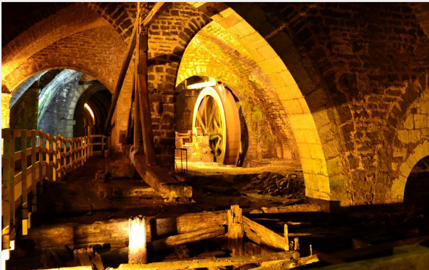
Grande Saline de Salins-les-Bains