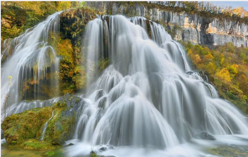
Cascades des tufs de Baume-les-Messieurs