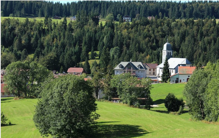
Bellefontaine (Gérard Gerbod )