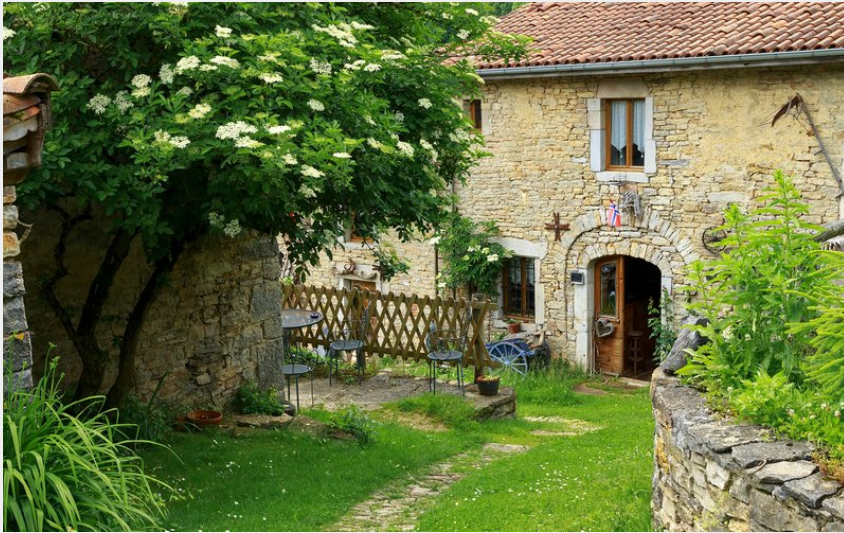
Maison dans Montagna-Le-Reconduit