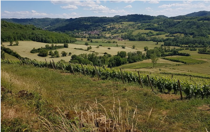
Village de Moiron