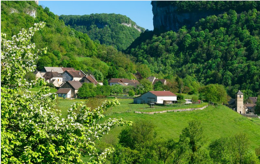
Baume-les-Messieurs, l'un des Plus Beaux Villages de France