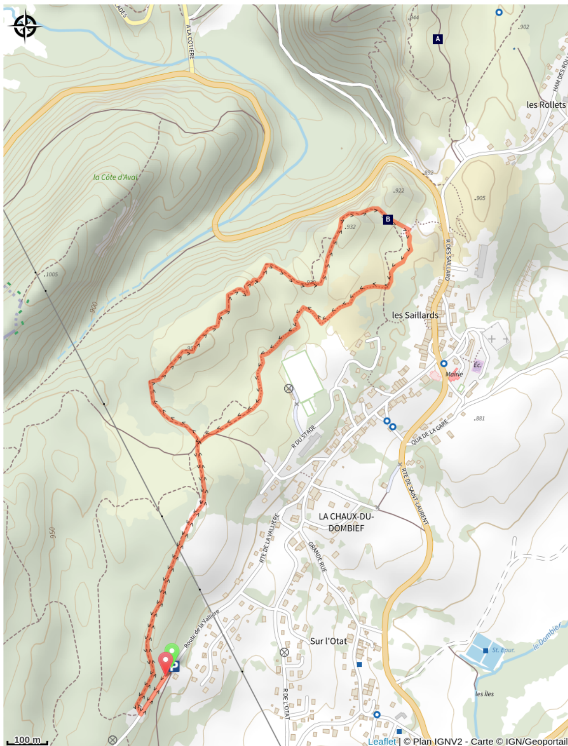
Les pelouses sèches (A)