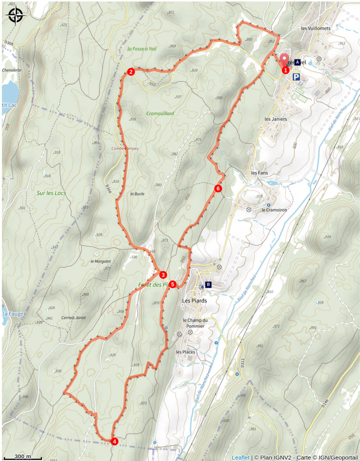
Évolution de la vie, évolution du bâti. (A)