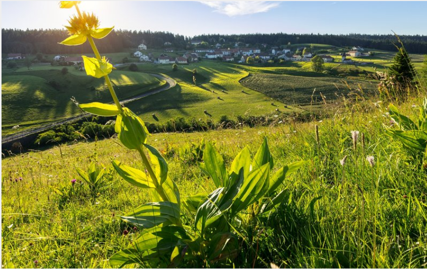
Village des Piards