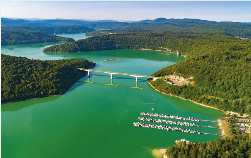
Lac de Vouglans