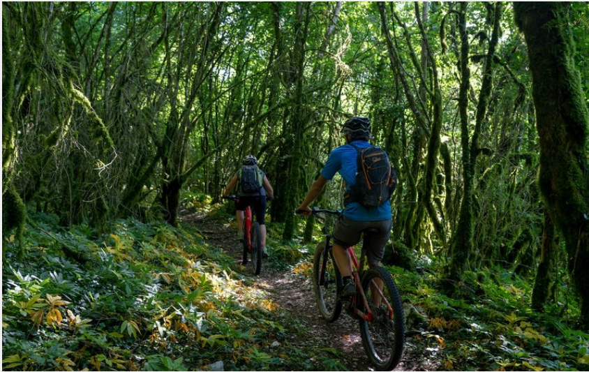
VTT en forêt autour du lac de Vouglans