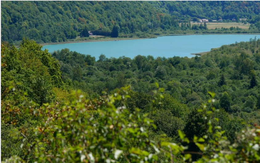
Lac de Chambly (Terre d'Émeraude Tourisme)