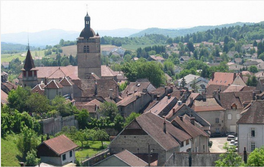
Orgelet (Terre d'Émeraude Tourisme)