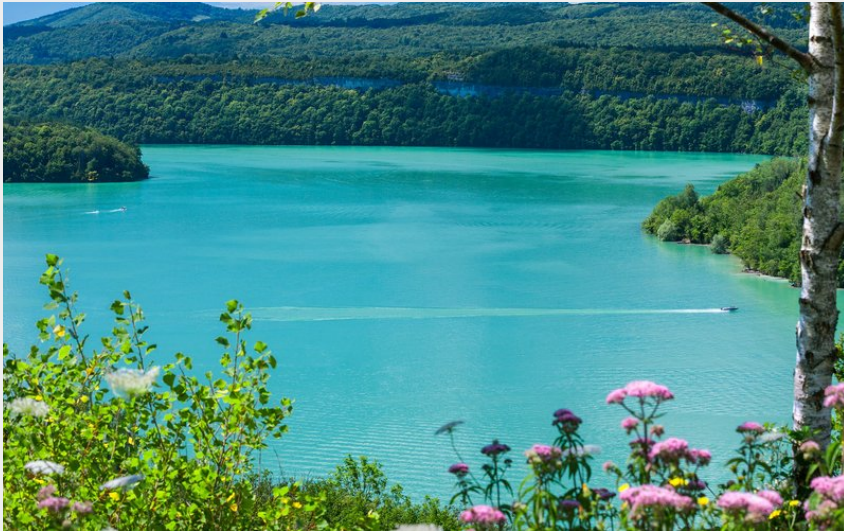
Lac de Vouglans depuis le Regardoir