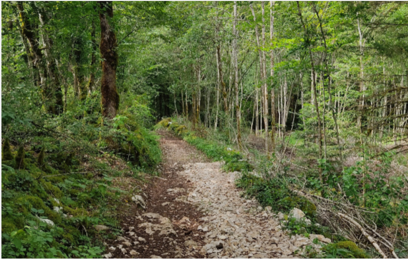
Autour du désert (Terre d'Émeraude Tourisme)