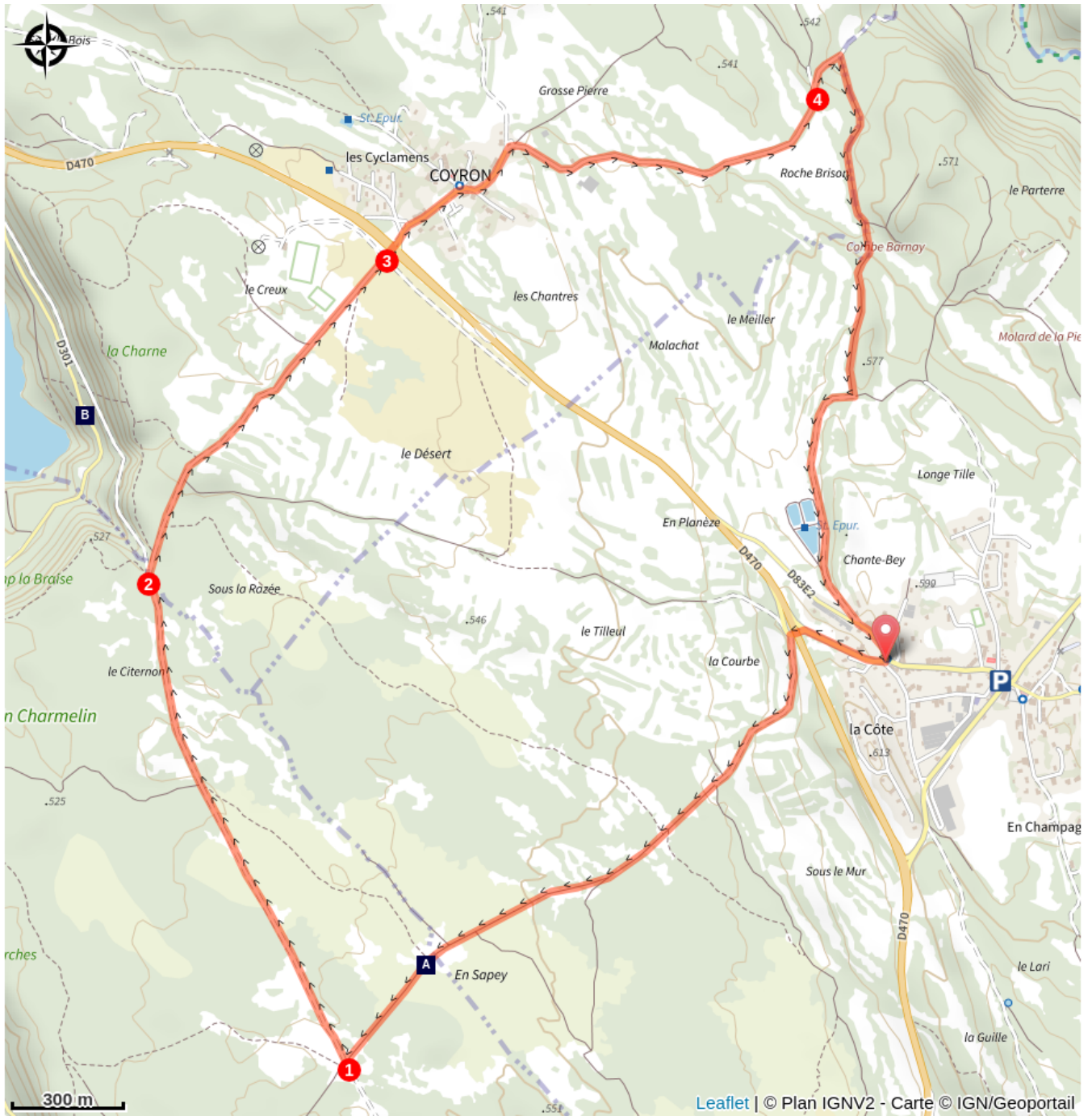
Pelouses sèches (A)