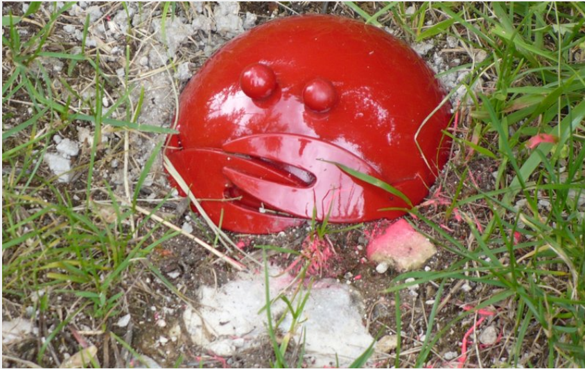
Les crabes rouges à suivre !