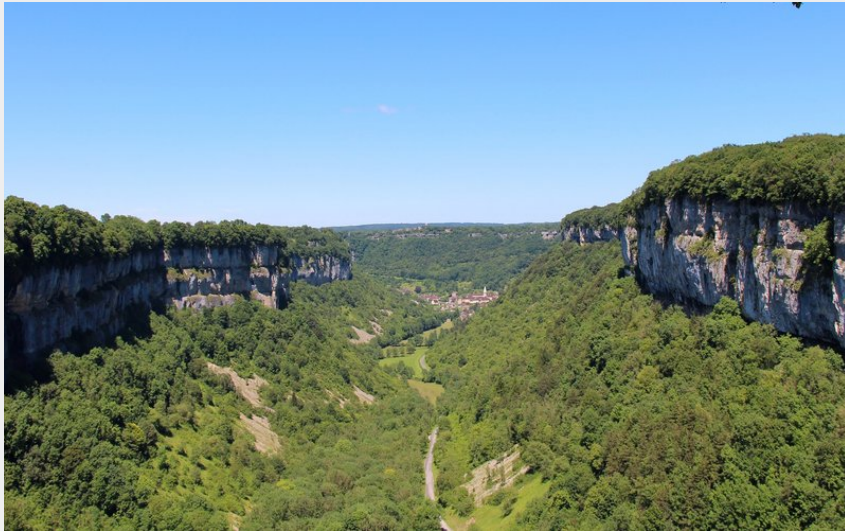
Baume-les-Messieurs depuis le belvédère de Crançot