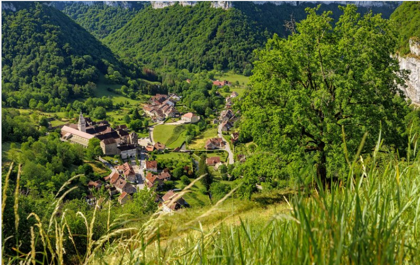
Belvédère de Granges-sur-Baume