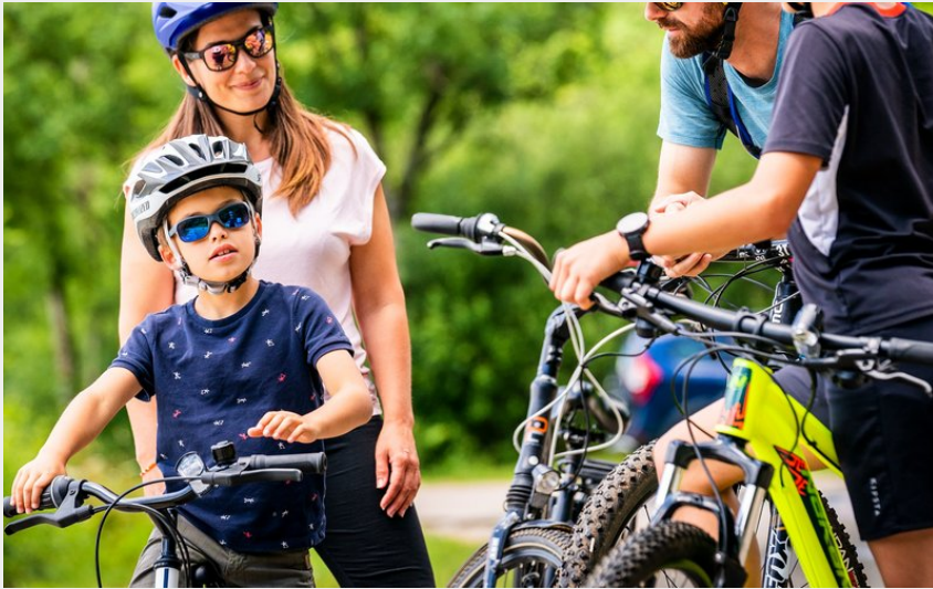
Famille en VTT