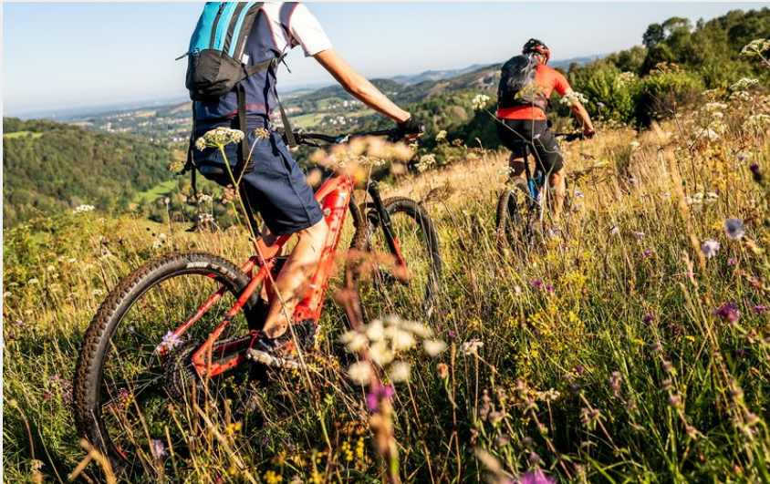
Vététistes sur le parcours du Savignard