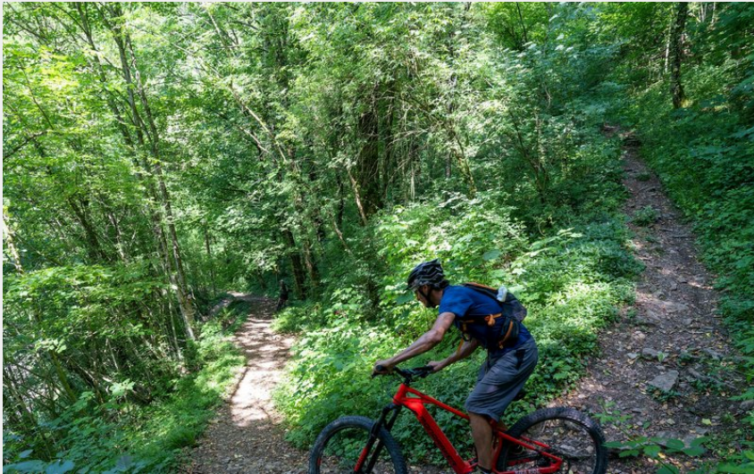
VTTAE (VTT électrique) descente - Le Chemin du Facteur