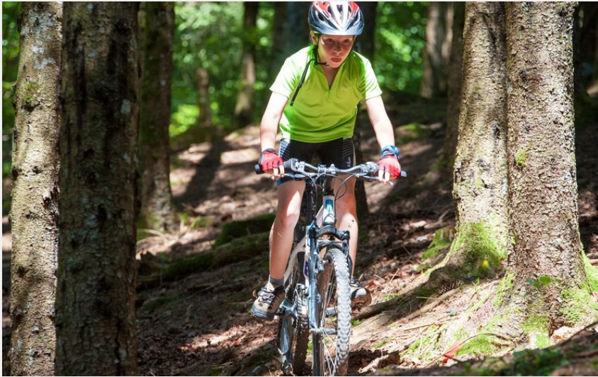
VTT dans une forêt du Haut-Jura