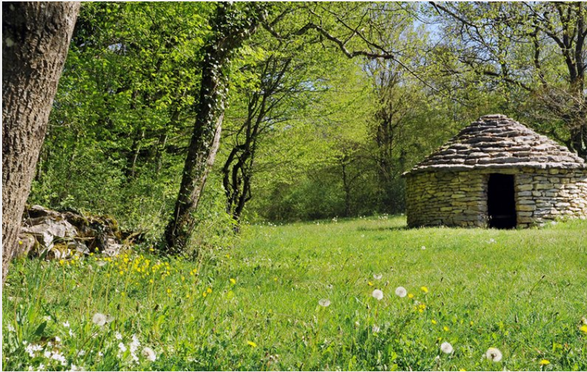
La Caborde de Rosay